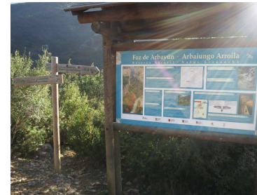
ARBAIUNGO ARROILA FOZ DE ARBAIUN THE GORGE OF ARBAYUN